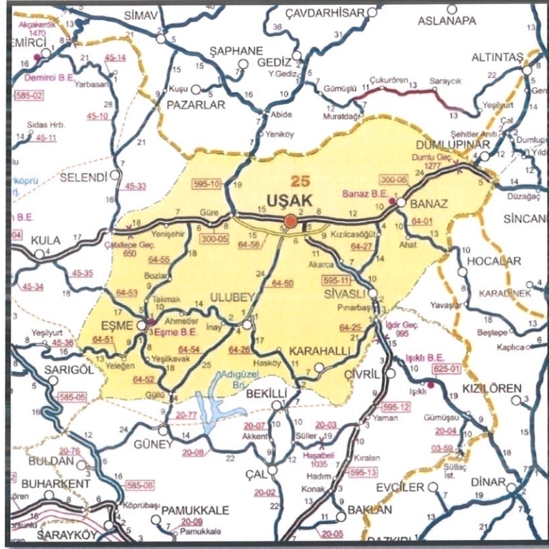
HARİTA 3: UŞAK İLİ KARAYOLLARI HARİTASI

Demiryolu: Afyon-Uşak-İzmir Demiryolu il merkezinden geçmekte olup il sınırları içindeki demiryolu uzunluğu 159 km'dir. 1897 yılından bu yana hizmet veren hat, hızlı tren projesi kapsamına alınmıştır.